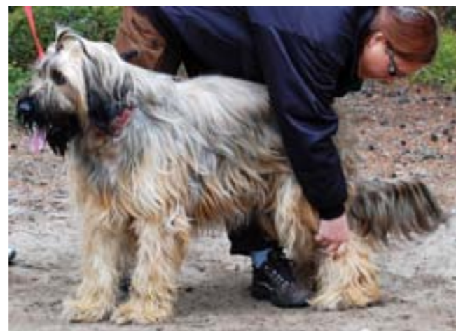
I första momentet hanteras hunden av testledaren.

MH kan också sägas vara en slags varudeklaration, eftersom de hundar som har gjort ett MH har ett "papper" på sina mentala egenskaper. I och med att vi i Sverige genom SBK mentalbeskriver många hundar av olika raser har vi också ett gediget och omfattande material om hur mentaliteten ser ut hos våra hundar. Med detta som underlag har uppfödarna goda förutsättningar att avla fram hundar som fungerar väl i den miljö vi lever i.