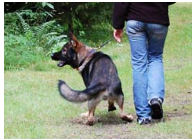
Hunden reagerar under momentet ljudkänslighet

Via MH-protokollen har många rasklubbar gjort en så kallad rasprofil, som beskriver den egna rasens egenska-